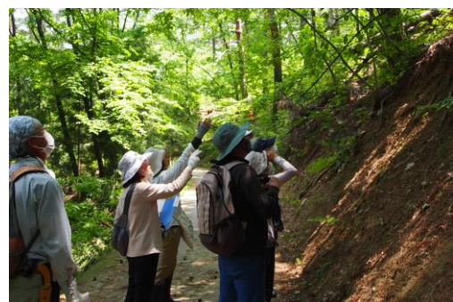
昨年の植物観察会の様子(5月)